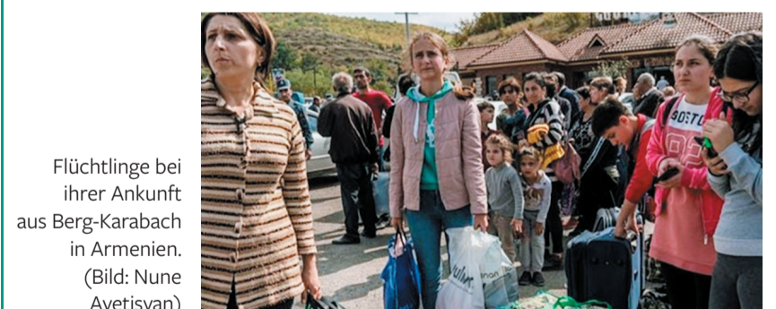
Flüchtlinge bei ihrer Ankunft aus Berg-Karabach in Armenien.