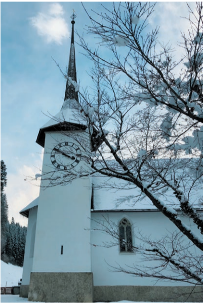
Kirche Eggiwil

Sonntag, 3. Dezember, 9.30 Uhr Familiengottesdienst zum 1. Advent mit den KUW-Schülerinnen und KUW-Schülern der 3. Klasse, dem KUW-Team und Pfr. Ueli Schürch. Zu diesem Gottesdienst ist die ganze Gemeinde herzlich eingeladen. An der Orgel: Esther Marti Predigt: Elisabeth Fankhauser, Mobile 079 246 08 40