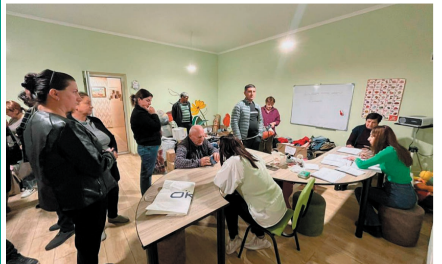
Dorfzentrum in Abovyan, wo sich Flüchtlinge aus Berg-Karabach bei Aelita für Unterstützung melden.