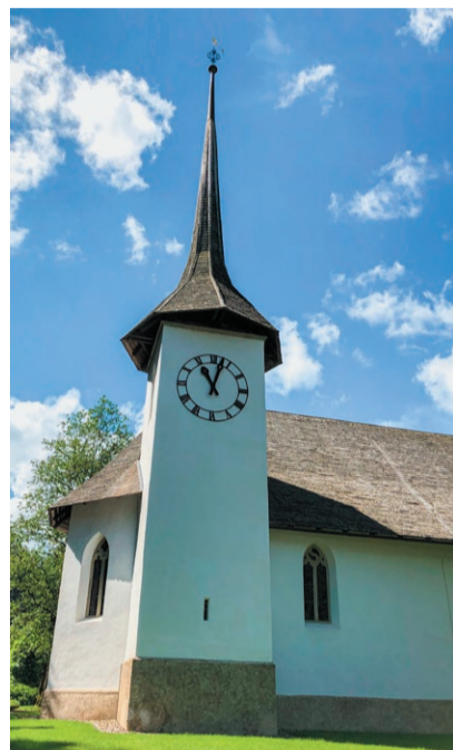
Kirche Eggiwil