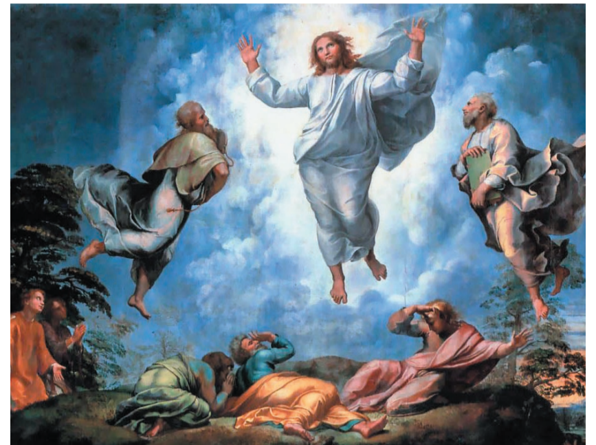
«Die Verklärung Christi» von Raffaello Sanzio

Den Text in Markus 9, 2–8 sehe ich ganz in Weiss. Der Titel über diesem Abschnitt ist in vielen Bibelübersetzungen irreführend. «Die Verklärung Jesu.» Es geht nicht darum, dass Jesus geistig verklärt und irgendwie nebulös wäre. Jesus geht auf einen hohen Berg. Drei Jünger kommen mit und erleben, dass