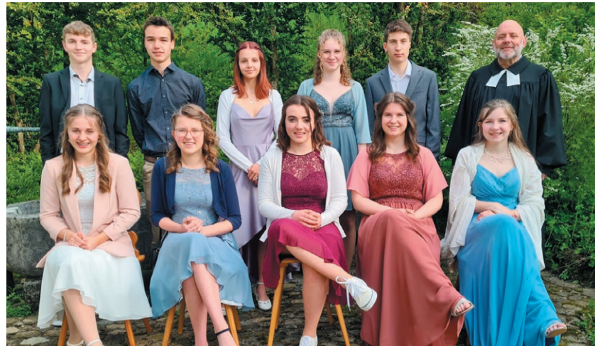
Konfirmandinnen und Konfirmanden der Sek-Klasse