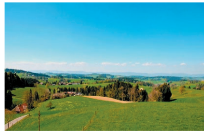
oben: Panoramarestaurant Fritzenfluh unten: Fritzenfluh-Sommersaussicht

Mit dem Sommer-Car sind wir unterwegs auf bekannten und wohl auch unbekanntem Strassen durchs Emmental. Das Mittagessen werden wir im Panoramarestaurant Fritzenfluh geniessen. Danach geht unsere Reise westwärts weiter an den Rand des Emmentals, wo wir noch einen vergnüglichen Zvierihalt einschalten werden. Nähere Informationen finden Sie im nächsten «reformiert.». Zudem liegen an verschiedenen Orten, wie üblich, Flyer mit Anmeldetalon auf.