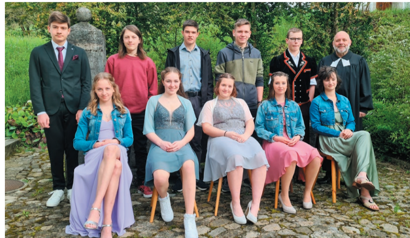
Konfirmandinnen und Konfirmanden der Real-Klasse