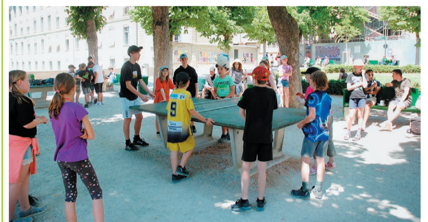
Konfirmation Eggiwil 2023