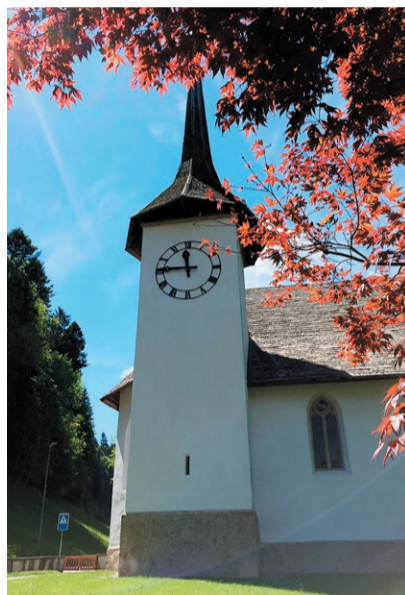
Kirche Eggiwil