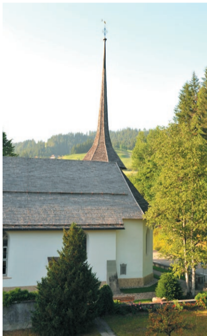
Kirche Eggiwil